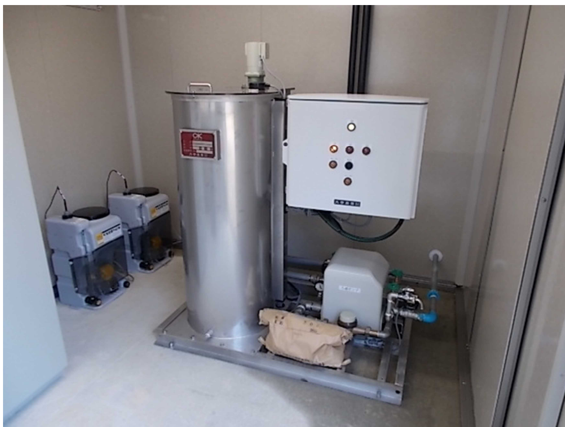
田原浄水場 ろ過装置設置