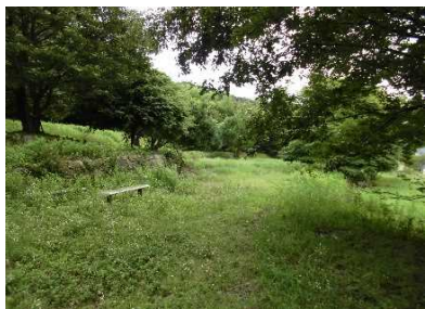
⑤やんちゃの森全景