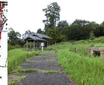
⑧多目的広場から宮津湾望む