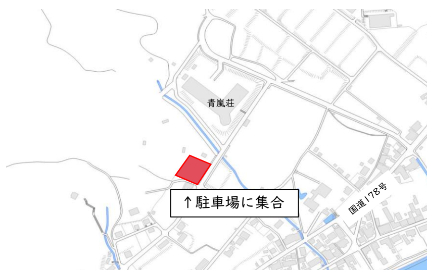
<案件3>日置ふれあい公園