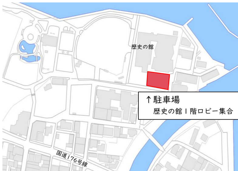
<案件1>ウォーターフロントエリア