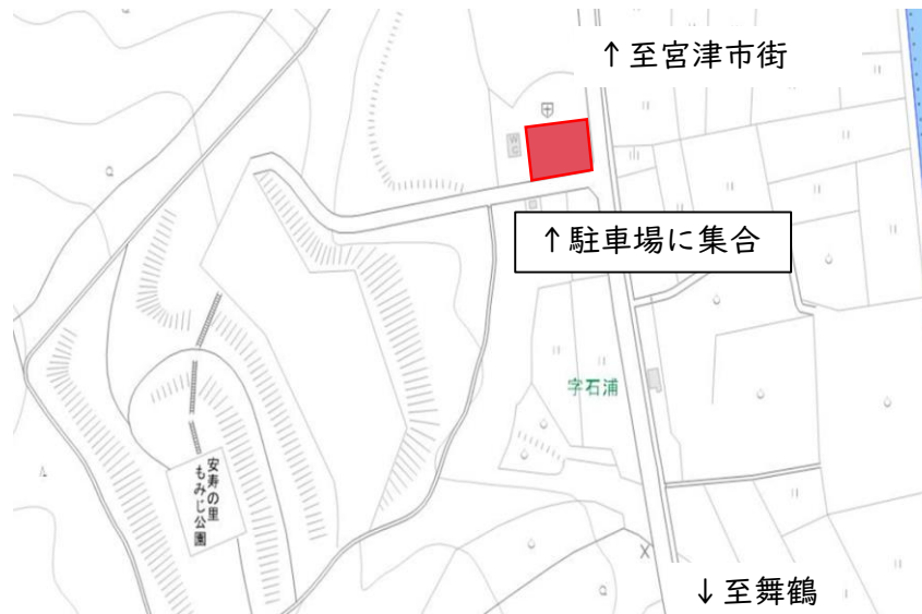
<案件2>安寿の里もみじ公園