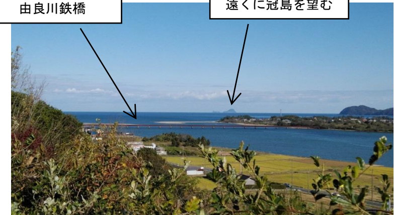
遠くに冠島を望む