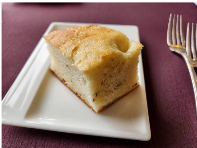
オリーブフォカッチャ