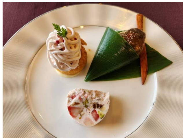
いちごデザート盛り合わせ