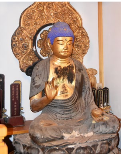
龍燈寺の木造薬師如来坐像